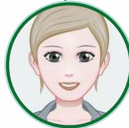
Réseaux formateurs - Intervenants SF